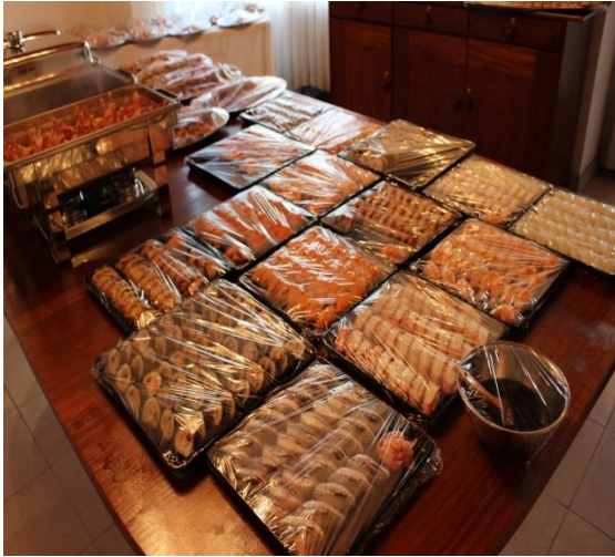
La Cuisine Japonaise (Sushi, Tempura)