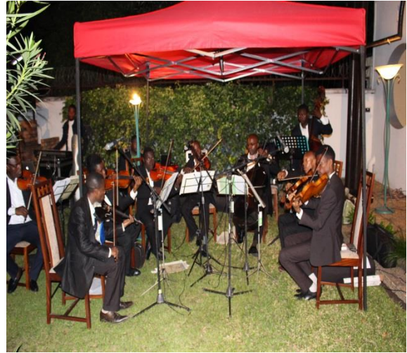
Musique de l'Orchestre symphonique Kimbanguiste