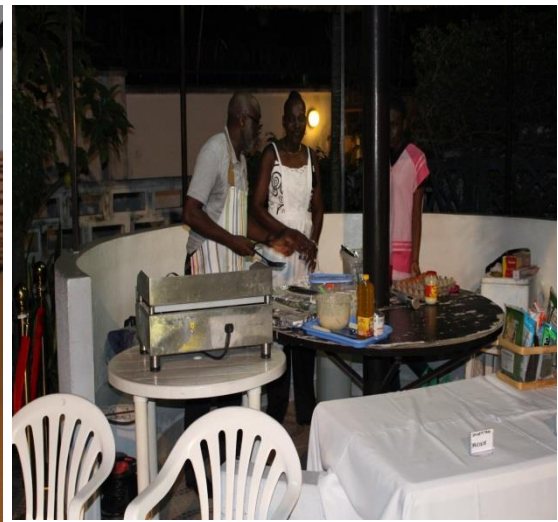
Okonomiyaki par les cuisiniers congolais