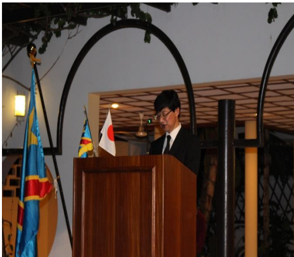
Discours de l'Ambassadeur