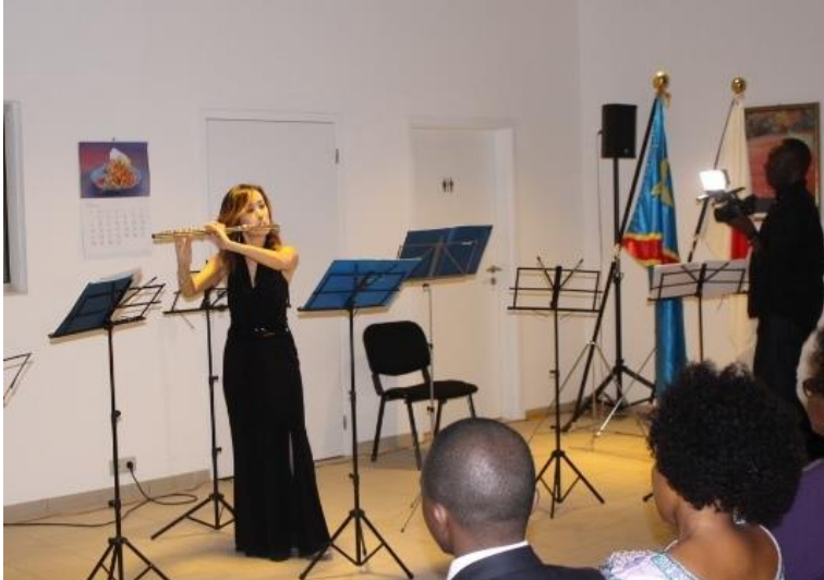
Madame FUJII, une flutiste japonaise de renommée internationale, basée à New York