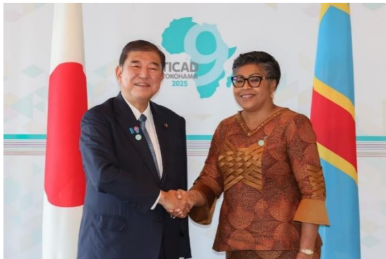
日・コンゴ（民）首脳会談（2025年8月21日）

首都キンシャサにおいて、コンゴ（民）の様々な関係者とのネットワーキングとともに、コンゴ（民）という国、その国民性を肌感覚で感じて頂くことができる貴重な機会と考えております。皆様のご参加をお待ちしております。