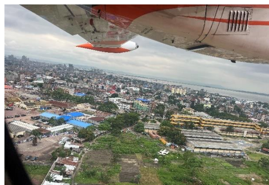
首都キンシャサ市内の街並み