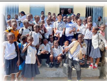
2年後フォローアップ視察

草の根無償資金協力は小規模でありながらもおよそ1年で案件を完了できる比較的迅速な支援です。プロジェクトの始まりから完了までを見届けることができる点は委嘱員業務の醍醐味かと思えます。案件実施中の困難や苦労、2年後フォローアップでの裨益効果の確認まで、案件全体を被供与団体とともに歩むことができた経験は自身の今後の糧となっていると思います。委嘱契約という立場ですが、日本国大使館の皆さんや現地職員、草の根案件で関わった当国の皆さんのおかげで無事に任務を終えられることに心より感謝しております。