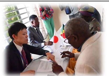
調達契約についての説明

案件の申請・選考を経て、案件が承認されると、案件開始に向けた署名式を実施します。銀行口座の開設、建設会社や監査会社との連絡調整などで、委嘱員の業務が少し立て込む時期となります。資金の送金を年度内に完了させる必要がありますが、日本のように予定通りに進むことは少なくありません。計画的に進めつつ、かつ、臨機応変に対応することが求められます。署名式では、被供与団体と大使館の契約だけでなく、被供与団体と建設会社等の関係機関間の調達契約等も締結されます。